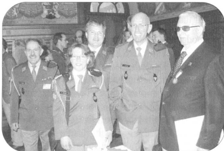
Ein Erinnerungsbild der gut gelaunten Berner Delegation an der DV des SFV in Bellinzona.