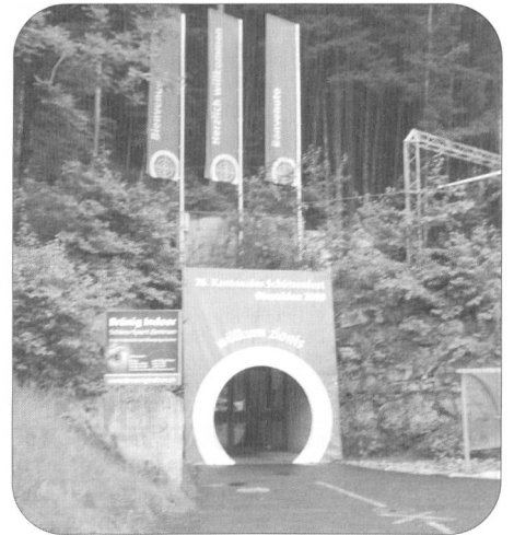
Eingang zur Anlage Brünig Indoor.

Kennen Sie die weltweit einzigartige unterirdische Schiessanlage Brünig Indoor? Wenn nicht, dann haben Sie wahrlich etwas verpasst. Schiessen bei Kunstlicht ist nämlich gewöhnungsbedürftig. Die Luft ist mit Pulverdampf geschwängert und die Sicht im 300 m Schiessstunnel mit 3-stöckiger Scheibenanordnung ist getrübt durch einen leichten Nebelschleier.