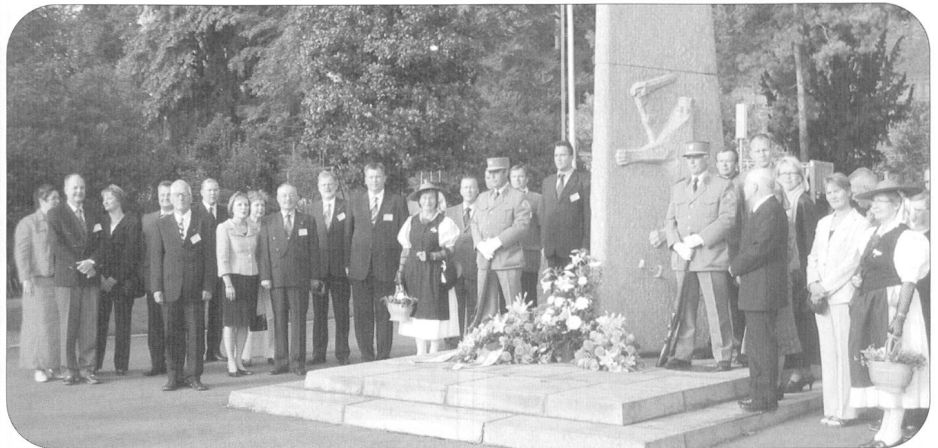
Am vierten Tag wohnten die finnischen Logistikoffiziere einer eindrücklichen Zeremonie am Denkmal von Maréchal Mannerheim in Montreux bei.

ARMEE-LOGISTIK-Leser erinnern sich: Vor zwei Jahren waren während einer ganzen Woche finnische Logistikoffiziere mit Begleitung Gäste bei der SOLOG. Kürzlich traf nun eine Gegeneinladung ein.