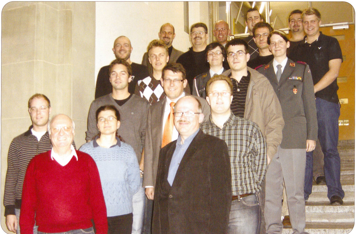
BERN. – Gemeinsam organisierten die Dachverbände SOLOG und SFV zusammen mit der LBA, Truppenrechnungswesen, in Luzern, Kloten und Bern einen Aus- und Weiterbildungskurs. Aus erster Hand wurden die Teilnehmer über alle Neuerungen im Kommissariatsdienst, beim Verpflegungsdienst und in der Truppenbuchhaltung umfassend auf dem Laufenden gehalten. Fazit: Allseits zufriedene und dankbare Teilnehmer.