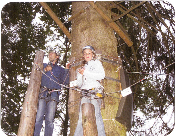
Mutprobe auch für zehn Mitglieder des SFV Ostschweiz, die Anfang September den Seilpark Kronberg, Jakobsbad, besuchten und dies zu einem geselligen Anlass im Jahresprogramm machten.

Cash+Carry CCA Angehrn Frische für Profis.