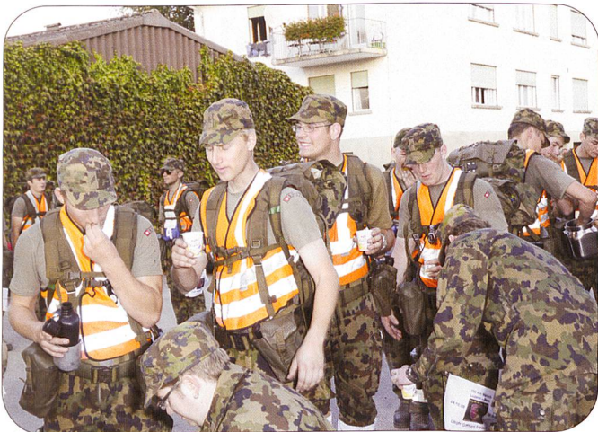
Hundert Kilometer von Luzern nach Bern ist kein Sonntagsspaziergang. Trotzdem nahmens die Absolventen der Logistik-Offiziersschule gelassen.