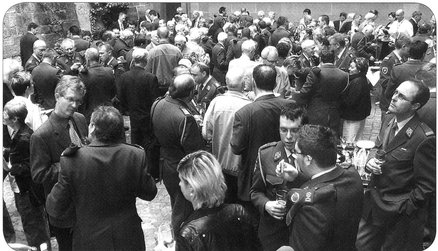
Apéro im Innenhof des Rathauses Basel-Stadt