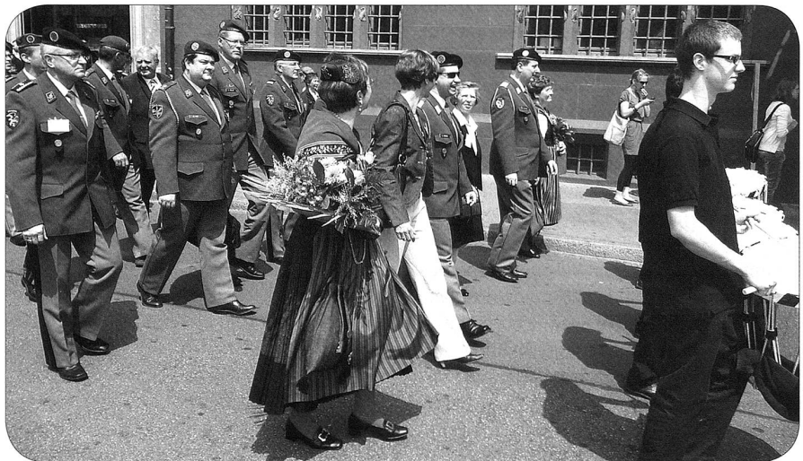
Umzug mit Trachtendamen