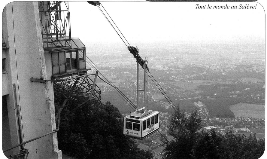
Arrivée au sommet