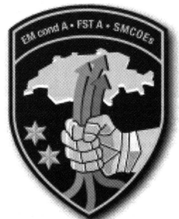
Der Badge des FST A, dem der Militärische Nachrichtendienst der Schweizer Armee zugeordnet ist.

Als weitere direkte Gefahren sind politische und wirtschaftliche Druckversuche aus dem Ausland anzusehen. Sie sind Teil staatlicher ausländischer Interessenspolitik und nicht darauf ausgerichtet, primär die Schweiz zu schädigen, sondern dem eigenen Staat Vorteile zu verschaffen.