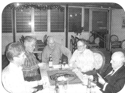
Observez le magnifique tapis!