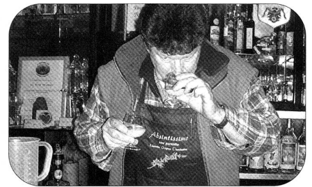
Sentir avant de servir!