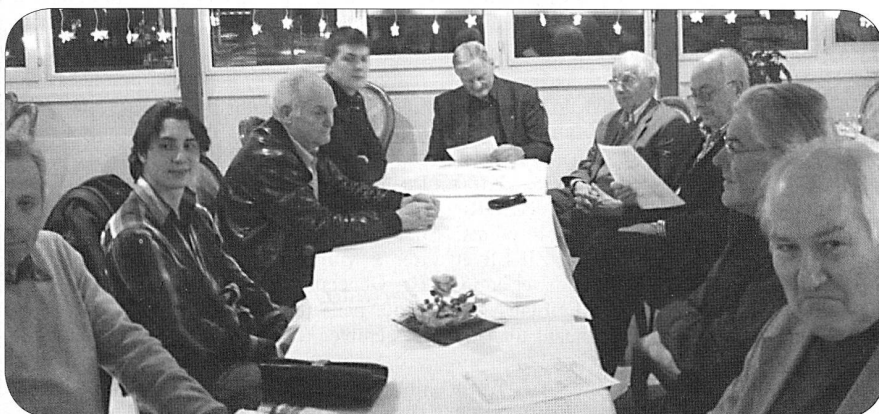
Une partie des participants à l'AG