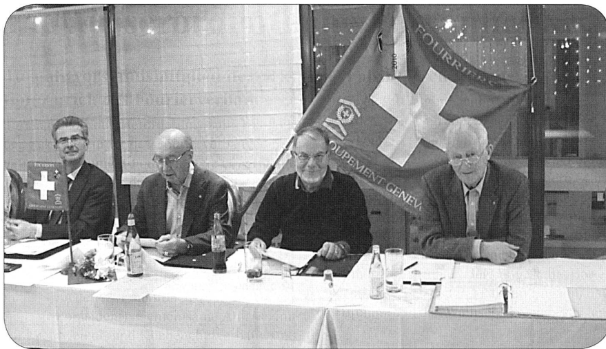
Quelques membres du comité

Chaque équipe a été récompensée selon son rang et non pas selon ses capacités (n'est-ce pas les GRANDS spécialistes des cartes!!!).