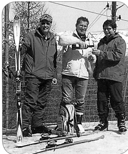
La neige donne soif...