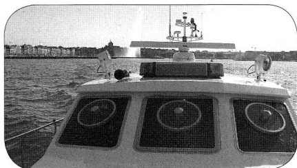
à bord de la vedette avec le Jet-d'eau en arrière-plan

liciers plus un chef et une secrétaire. Leur base abrite encore un garage avec un véhicule tout-terrain, des vestiaires ordinaire ou de plongée, un bureau, une cuisine et, sur le toit, un hélicoptère. Après cette présentation, nous avons assisté à la projection d'un film fort intéressant sur les entraînements hivernaux des plongeurs sous la glace (lacs Lioson ou Retaud), au sauvetage d'un imprudent tombé des berges dans le Rhône, à l'assistance à des navigateurs de voiliers qui avaient chaviré, enfin au travail assisté du robot en milieu sous-lacustre.