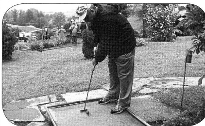
notre président très concentré