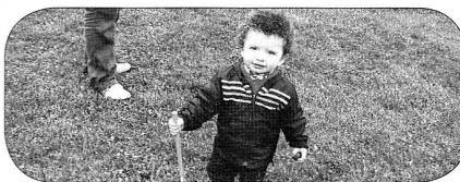
sait-on jamais, peut-être un futur fourrier...