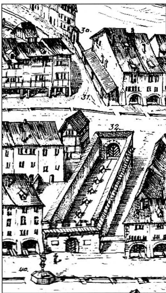
Abbildung 2: Gregorius Sickinger, Plan der Stadt Bern (um 1604, Ausschnitt), 1915 von Eduard von Rodt nach der Kopie von Johann Ludwig Aberli umgezeichnet; obere Fleischschal mit den Fleischbänken (Arola-Verlag; Historisches Museum Bern).

Die Lokalisierung der Wochenmärkte in den Städten ist bekannt. Fleisch von Kleinvieh (Geflügel, Kaninchen, Gitz, Lämmer) wurde meist zusammen mit Butter auf den „Ankenmärkten“, an schattseitigen Lauben, verkauft, in Bern an der Münsterergasse, in Murten an der Hauptgasse gegen das Rübenloch. Kleinvieh wurde, wie noch vor 100 Jahren, von der Hausfrau häufig auf dem Kleinviehmarkt lebend gekauft und zu Hause getötet. Die Domizile und Arbeitsstätten der Metzger waren auf bestimmte Gassen konzentriert (Gerber 2001). Dort verkauften sie geniessbare Schlachtnebenprodukte. Im wesentlichen mussten sie Fleisch aber in der Fleischschal verkaufen, wo nur so viele Metzger zugelassen waren, wie Fleischbänke zur Verfügung gestellt wurden. In Bern befand sie sich ursprünglich in der Kramgasse und in der Gerechtigkeitsgasse je auf einer gedeckten grossen Holztribüne über dem Stadtbach. Später wurden feste, mit einer Mauer umgebene Einrichtungen gebaut, in Bern an der Kramgasse an der Stelle des heutigen Konservatoriums (Abb. 2), in Freiburg oben an der Metzgergasse, in Burgdorf