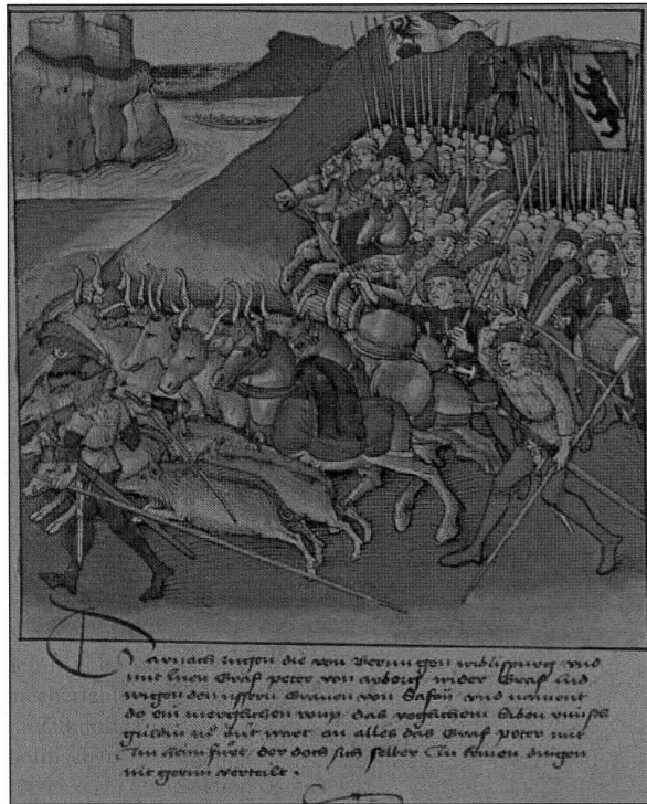
Abbildung 1: Diebold Schilling, Spiezer Bilderchronik (1484/85); ein Raubzug nach Avenches (Burgerbibliothek Bern, Mss.h.h. I.16).

Die Fleischversorgung hatte in der mittelalterlichen Stadt eine besondere Bedeutung, weil in der Nähe der Städte