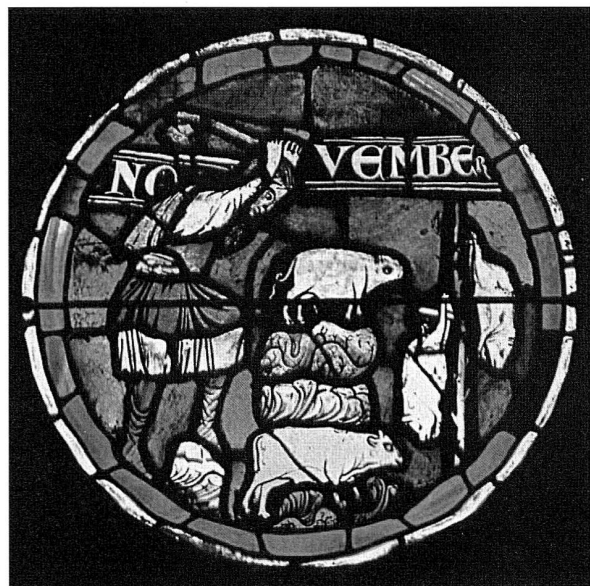
Abbildung 3: La grande Rose de la Cathédrale de Lausanne (1235), Novembre (Bibliothèque Nationale, KLb 105). La hache levée le boucher se prépare à abattre un boeuf; près de lui, un porc attend le même sort et deux autres porcs déjà dépouillés pendent au poteau.

hinter dem Kronenplatz, in Thun beim Rathaus an der Aare und in Rheinfelden am Gewerbekanal im nordwestlichen Teil der Stadt. Aus mittelalterlichen Bilddarstellungen darf geschlossen werden, dass Kälber, Schweine, Schafe und Ziegen in ganzen Tierkörpern, mit den Nieren und den Organen der Brusthöhle im Körperverband an den Fleischbänken aufgehängt und stückweise abgehauen und ausgewogen wurden. Rindfleisch wurde wohl in Vierteln zum Markt gebracht. Während für die Muskelfleischstücke in den amtlichen Erlassen kaum Benennungen zu finden sind, werden die Innereien detailliert bezeichnet: Grick, Krös, Uterli, Reyden (d.h. Labmagen), Kutteln, Bodendarm, Arsdarm. Als Fleischwaren seien erwähnt: Würste, Blutwürste, Schluchbraten, Speckseiten. Der Verkauf von Pferdefleisch ist nur vereinzelt belegt.