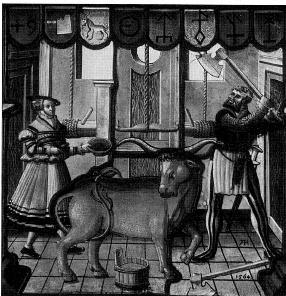
Abbildung 5: Andreas Hör, Zunftscheibe Sankt Gallen (1564, Ausschnitt), Rinderschlachtung, Schlachtkran (Schweizerisches Landesmuseum, IN-67.26).

worden. Rinder wurden auf einem einfachen Rückenlager geschlachtet (Abb. 4). Einen Beleg für die Rinderschlachtung am Schlachtkran liefert indessen ein Glasgemälde der Metzgerzunft von Sankt Gallen von 1564 (Abb. 5).