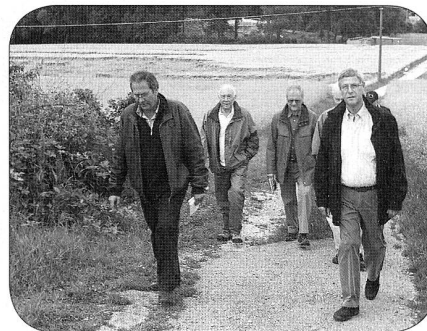
En pleine marche...

05.09. 18.30 Stamm ordinaire, Restaurant Landhus 08.10. 18.30 Stamm ordinaire, Restaurant Landhus