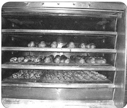
Prêts à être consommés!