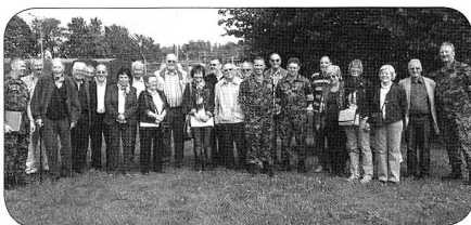
Gruppenbild der Pensionierten/Ehemaligen «Hellgrünen / Ns Rs» des OKK/Vsg Trp, BALOG und LVb Log mit dem Kdt LVb Log, Brigadier Melchior Stoller und dem Kdt Ns Rs Schulen 45, Oberst Marcel Derungs

Auch im 2013 wird der Pensioniertentag der «Hellgrünen / Ns Rs» wiederum in Freiburg durchgeführt und der Kdt Ns Rs Schulen 45 mit seinem Team freut sich bereits heute auf eine zahlreiche Teilnahme.