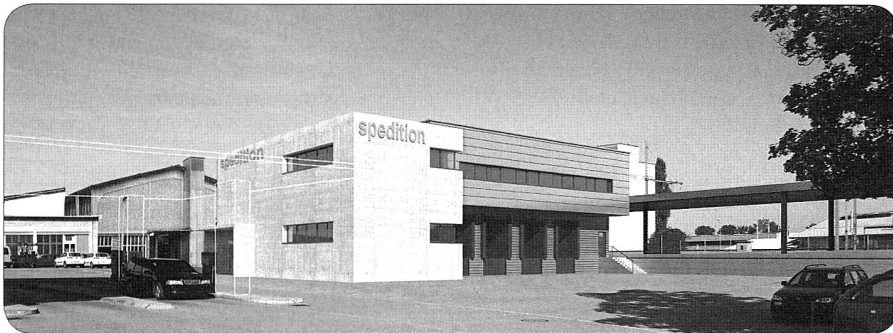
Fotomontage: Geplante Modernisierung des Armeelogistikcenters Hinwil

center Hinwil soll als Zeitzeuge erhalten, bewahrt und mit Neubauten ergänzt werden. Das Speditionsgebäude, die Halle HA und die Halle HC, die Waschanlage und die Entsorgungsstelle werden neu gebaut. Das Betriebsgebäude BG sowie die Hallen HB und HD werden saniert. Damit wird die gesamte Anlage den heutigen und auch den zukünftigen Nutzungsanforderungen gerecht und wird auch den aktuellen Bedürfnissen bezüglich Umweltschutz und Energieverbrauchsoptimierung nachgekommen.