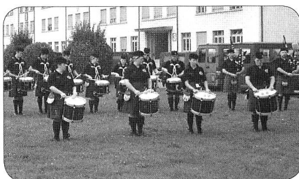
Stockbridge Pipe Band of Edinburgh