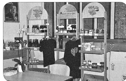
Tous les produits du terroir exposés

Et maintenant, l'apéritif, comme promis, dans cette salle où sont exposés divers produits du label «GENÈVE RÉGION-TERRE AVENIR» des huiles de colza, de tournesol, de graines de courge, de noix, de lin et des sachets et bocaux contenant toutes ces merveilles aux saveurs inégalées qu'on vient de vous décrire. On