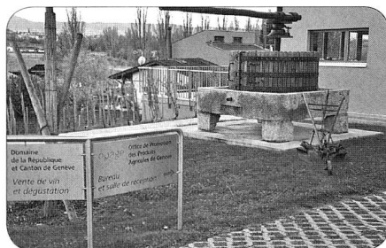
Entrée de la maison du terroir

OPAGE, Office de Promotion des Produits Agricoles de Genève, route de Sorat 93 à Bernex, en plein vignoble de Lully. C'est là que