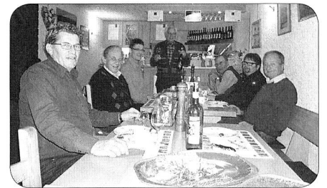
Tout est prêt, le programme 2013 et le repas