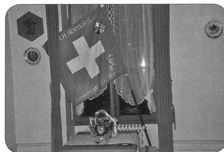
Marmite de l'Escalade, 4,326 kg