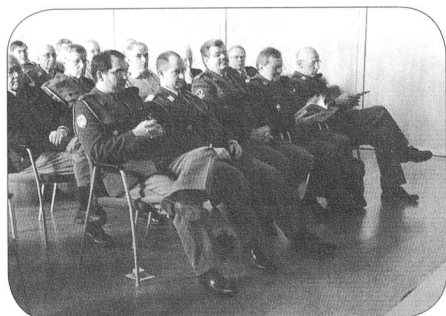
Des participants attentifs

Un grand merci au groupement vaudois qui avait parfaitement organisé cette manifestation. mw