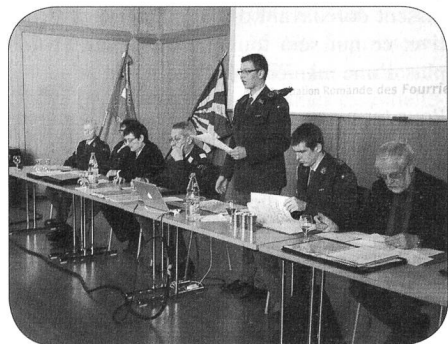
Le comité ARFS