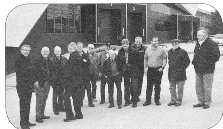
Les membres du groupement genevois présents à la visite

On nous présente encore un petit film qui présente le travail des délégués sur leurs lieux d'intervention. Une grande attention est por-