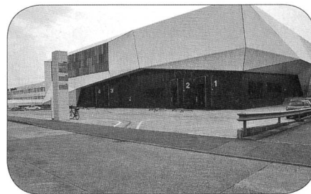
Vue de l'extérieur du bâtiment du CICR

A l'intérieur, nous découvrons le volume impressionnant de cette halle dont le rez surélevé mesure près de 10m de hauteur. Chaque ligne de rayonnages est conçue pour loger les palettes dans ses 3500 alvéoles auxquelles on accède au moyen d'élévateurs équipés