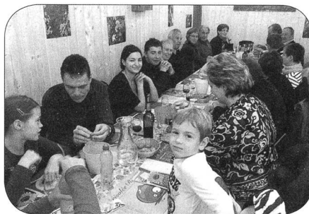
On attend le repas avec l'apéro

Il s'est installé au pied de la maison avec son brisoloir et tourne ses châtaignes, gentiment, calmement, secondé passivement, voire lascivement, par l'un ou l'autre d'entre nous, un verre à la main... le verre en cas d'incendie bien entendu!