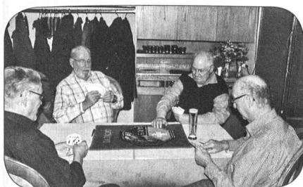
Qui a des atouts...