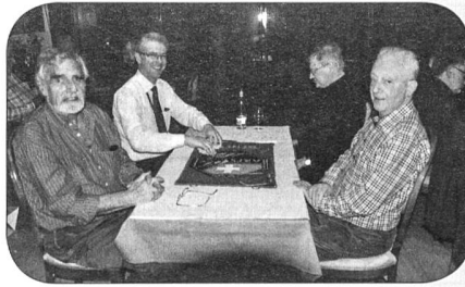
Prêt pour mélanger les cartes!