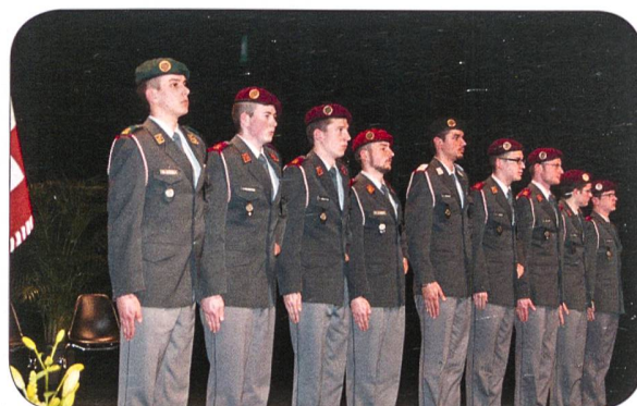
Beförderung der höh Uof