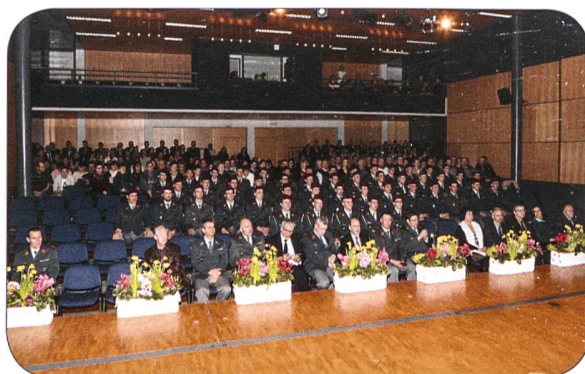
Saal in Tafers