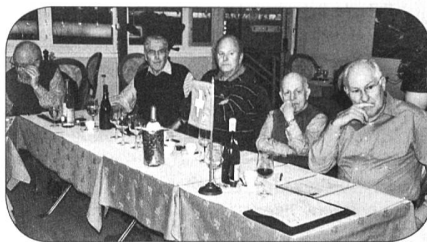
Des membres attentifs

Tous les rapports furent approuvés par l'assemblée. Bêat Rast nous transmit les salutations du président ARFS Mathieu Perrin qui n'a pas pu être des nôtres ce soir.