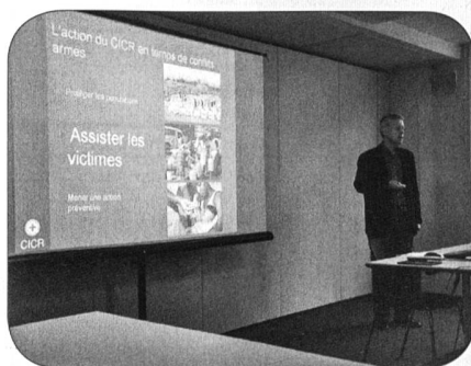
L'un des buts du CICR