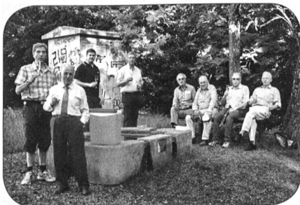
Pause bien méritée

Victime d'un très douloureux et subit lombago, notre président doit malheureusement nous