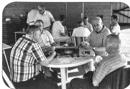
Les acharnés du jass!

Le stamm se prolongera sur la terrasse de l'auberge communale voisine où l'on refera le monde et où chacun ira de son commentaire sur les moindres faits et gestes du foot mondial et du tennis wimbledonien.