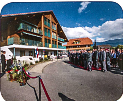
Gedenkstein mit Erinnerungstafel