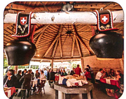
Währschafter Imbiss im Festpavillon