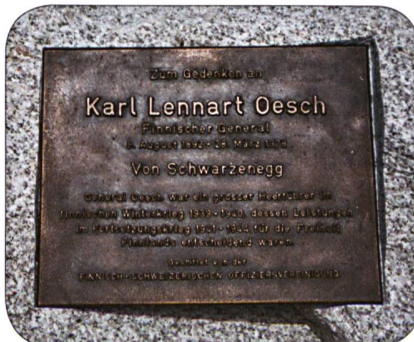
Inschrift Erinnerungstafel General Oesch