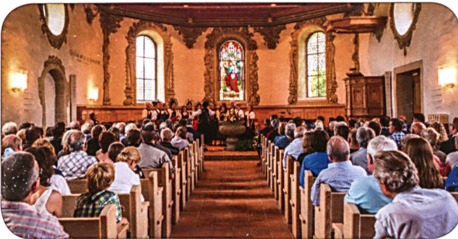
Kirche Schwarzenegg mit Publikum und Chor Trachtengruppe