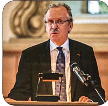
Botschafter der Republik Finnland in der Schweiz: Alpo Rusi