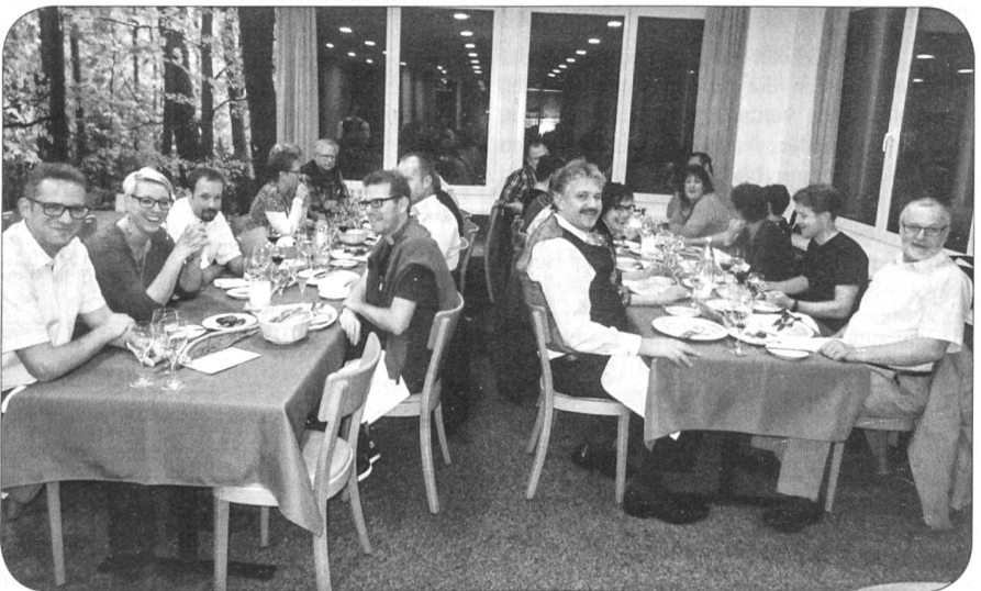
Die Gesellschaft nach der Arbeit