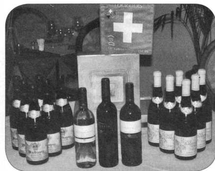
La planche des prix

Alors que certains souhaitaient venir s'échauffer et affûter leurs armes (aux cartes) dans l'après-midi, que «neini», les portes du restaurant n'ouvraient qu'à 17 heures 30. C'est ainsi que peu après 18 heures, les quatre