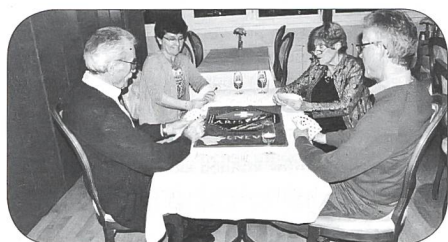
Une tablee en pleine action

fait «match» avec 157 points, puis la proclamation des résultats qui est le suivant: