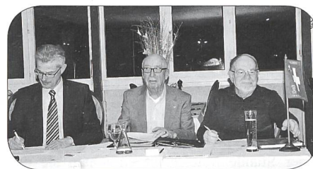
Une tablee en pleine action

Toutes les images sont trouvées sur la page 4 de la couverture