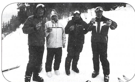
A gauche, il ne boit pas en stéréo mais il tient le verre du photographe