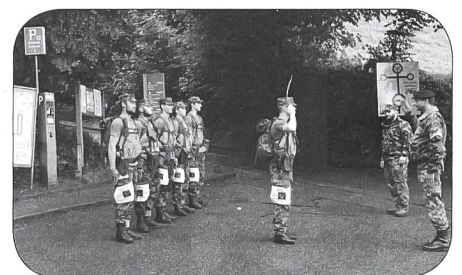
Abmelden in Lenzburg

Der traditionelle 100-km-Marsch am Ende der Offiziersschule wurde auch von der nun zu ende gegangenen Logistik Offiziersschule mit Erfolg absolviert. Einge Eindrücke finden sich auf den Seiten 11 bis 13 unten.