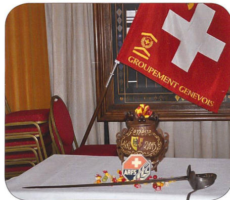
En bonne compagnie avec le drapeau du Groupement genevois