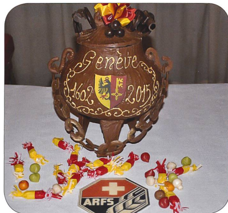
La fameuse marmite en chocolat