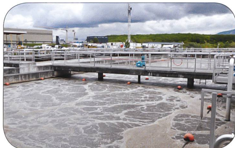
Agitateur au fond de la fosse de décantation.