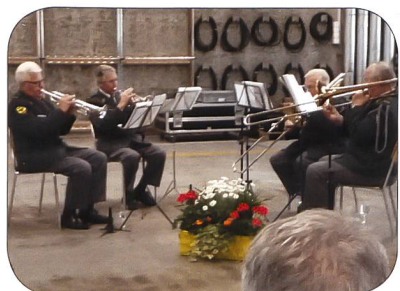
La musique nous accompagnait.