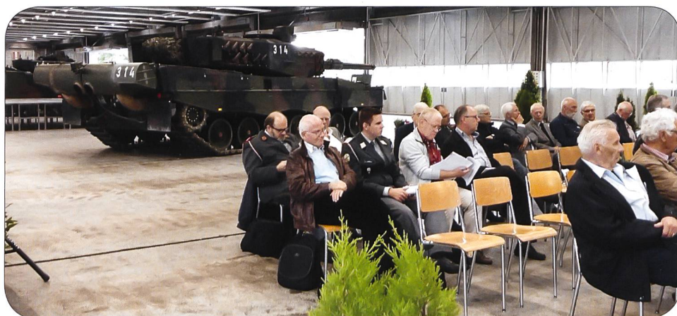
Une partie des membres présents et un char en toile de fond.