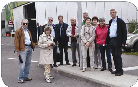
Les participants devant l'entrée de la STEP.