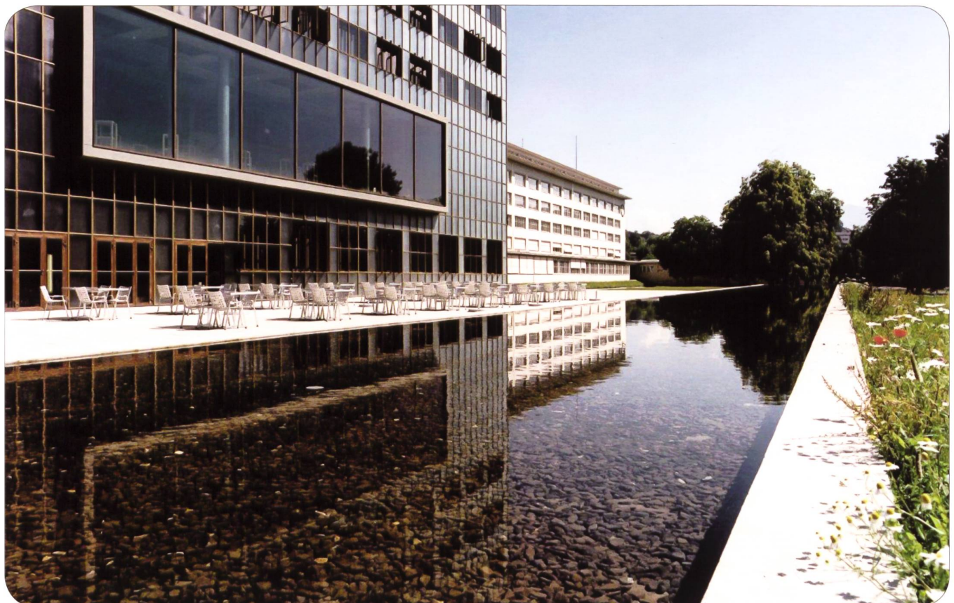
Armee-Ausbildungszentrum Luzern, Restaurant Murmatt