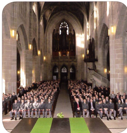
Publikum im Münster Bern