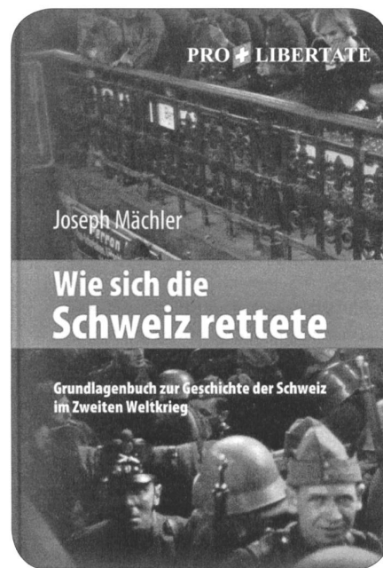
Titelseite Mächler red

Die Ansicht setzt sich durch, dass die Armee weder im Jura noch im Mittelland lange Wider-