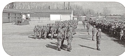
Präsentation der Kompanien

Nach der Präsentation der Kp wurden die Kader einzeln vorgestellt. In den Zugschulen wurden lustige Elemente eingebaut und brachten mit ihrer Darbietung die Eltern zum Lachen.