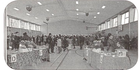
Empfang der Besucher in der Mehrzweckhalle Drognens

Auf dem ersten Arbeitsplatz wurde allen Besuchern die Gefechtsausbildung am Beispiel eines Begegnungsgefechtes dargestellt. Die einzelnen Schritte und Sequenzen wurden mit einfachen Worten erläutert. Als Besucher hatte ich grosse Freude festzustellen, dass in der Ns RS 45 die Gefechtsausbildung verbessert und ausgebaut wurde. Der Schulkommandant: «Neben dem Wachtdienst muss sich auch jeder AdA in einer Gefechtsituation zurechtfinden können. Deshalb haben wir das Ausbildungsschwergewicht zugunsten der Gefechtsausbildung angepasst. Die Schule kann von den Erfahrungen einzelner junger Berufsmilitärs mit Infanterieausbildung sehr profitieren.»