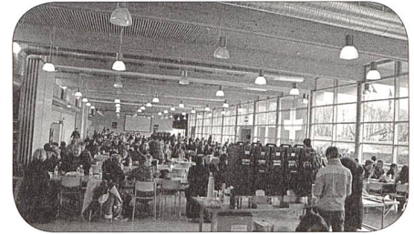
Verpflegung der Besucher

Man kann feststellen, dass die Angehörigen sehr interessiert sind, was ihr Sprössling in der