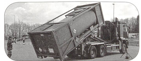
Betrieb eines Versorgungsplatzes

Die Rekruten präsentierten die für die Logistikformationen verfügbaren Fahrzeuge und die Umschlaggeräte im Einsatz. Interessant war das Aufeinanderschichten von Plastikfässern zu einem hohen Turm. Diese Arbeit erfordert