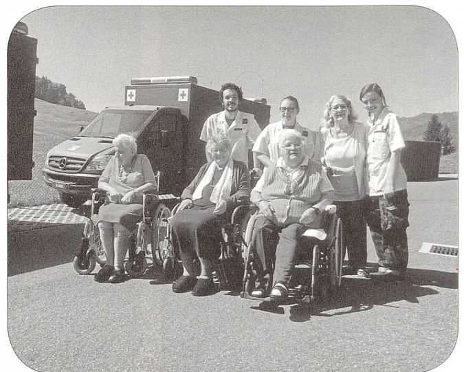
Patienten mit Pflegern