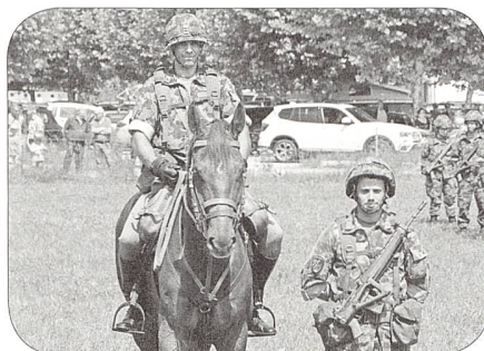
Kdo VDAT Abt 13