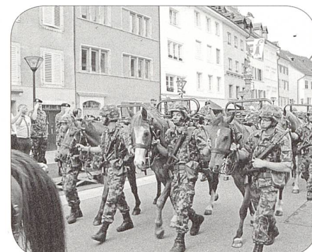
Aufmarsch der Tr Kol.