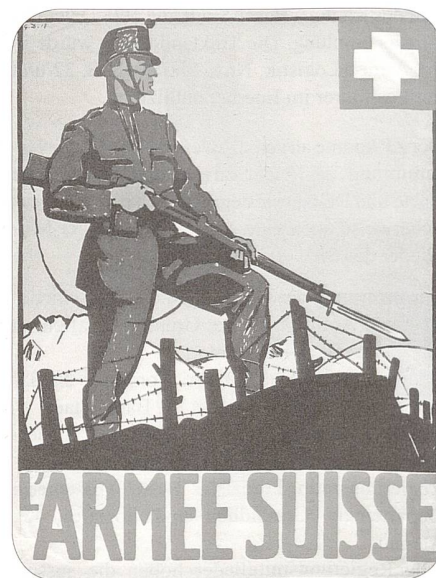
L'armee suisse 1918