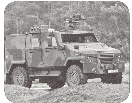
mowag eagle 4x4