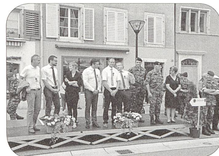
Regierung Kanton Jura