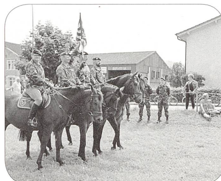
Stab Komp Zen VDAT