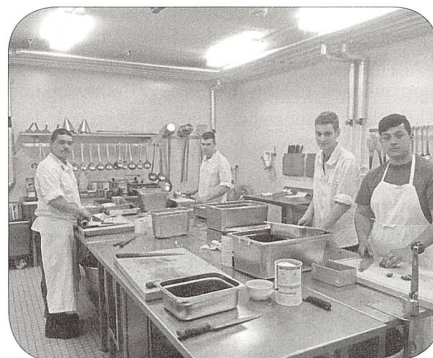
Küchenmannschaft im Einsatz