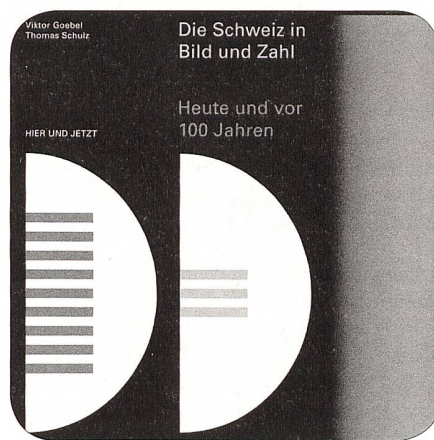
Goebel Schulz Die Schweiz in Bild und Zahl

Die Autoren zeigen anschaulich in rund 50 pointierten Gegenüberstellungen der Situation heute und vor 100 Jahren, wie sich die Schweiz und ihre Gesellschaft wandelten. Die einprägsamen, intuitiv lesbaren Grafiken machen überraschende Zu-