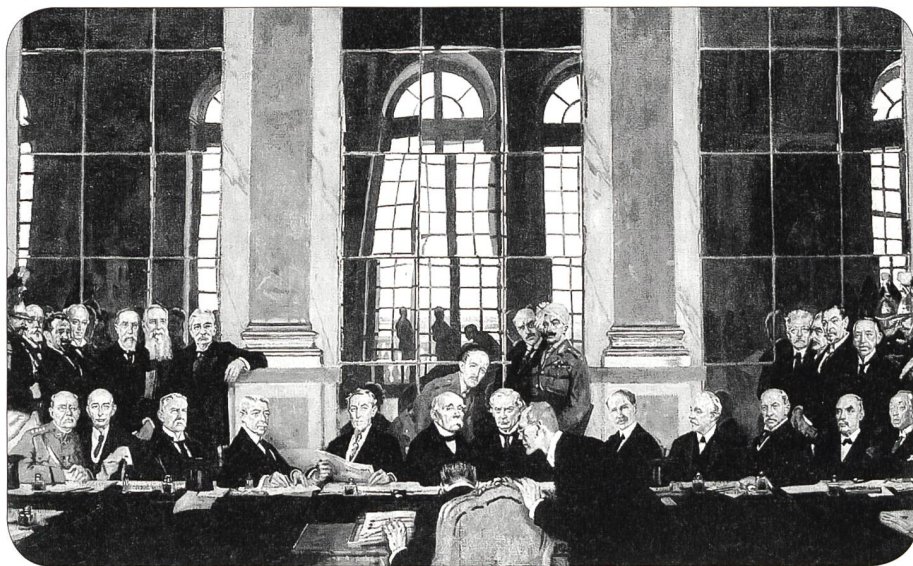
Vertragsunterzeichnung, Spiegelgalerie Schloss Versailles

Durch die Auflösung der beiden alten Staaten Österreich-Ungarn und Osmanisches Reich wurden weitere Friedensschlüsse mit den Nachfolgestaaten Österreich, Ungarn, Bulgarien und der Türkei abgeschlossen; damit entstand in Ostmitteleuropa eine Zwischenzone.