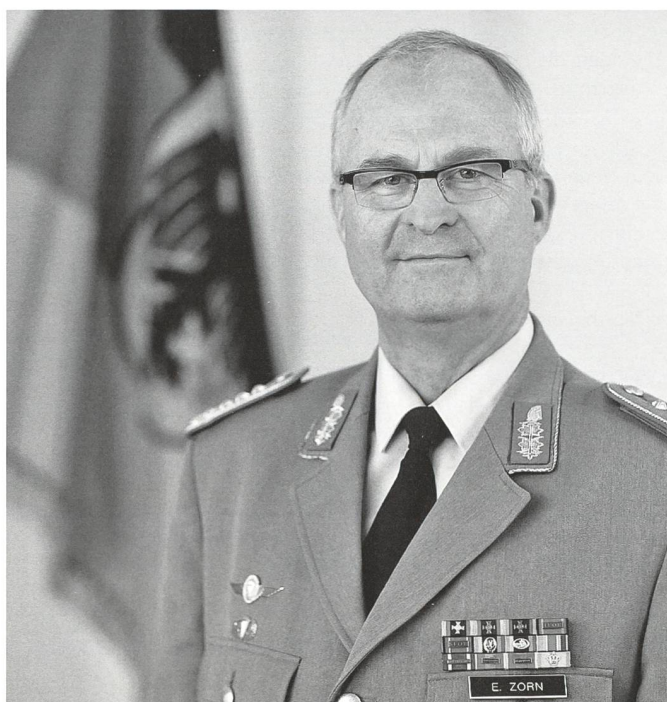
Generalinspekteur der Bundeswehr General Eberhard Zorn