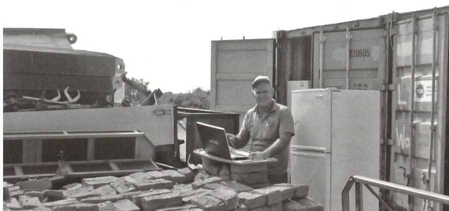
In der Humanitären Minenräumung benötigt es auch Logistik-Experten.

Strategisches Ziel 1: Die relevanten Übereinkommen werden umfassend umgesetzt und universell angewendet.