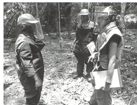
Die Schweizer Armee unterstützt UNO-Missionen auch im Bereich der Humanitären Minenräumung.

bessert werden. Grosse Landstriche wurden als minenfrei erklärt und der Lokalbevölkerung zur produktiven Nutzung zurückgegeben. Seit dem Inkrafttreten des Übereinkommens haben 31 Vertragsstaaten ihre Räumungsverpflichtungen erfüllt. Lager mit nahezu 53 Mio. Minen wurden vernichtet, so dass sie nicht mehr eingesetzt werden können. Zudem wurde die Unterstützung von Minenopfern als wichtige internationale Verpflichtung anerkannt, auch wenn sie teilweise inadäquat ist und nicht genügend Finanzmittel erhält.