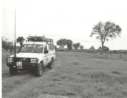
Die Fahrten ins Feld können anstrengend und zeitraubend sein.

Das Inkrafttreten des Übereinkommens über das Verbot von Antipersonenminen (Ottawa-Konvention) jährte sich 2019 zum zwanzigsten Mal. Das Übereinkommen zählt zu den erfolgreichsten im Abrüstungsbereich. Dank konkreter Aktivitäten vor Ort konnte der Schutz der Zivilbevölkerung in konfliktbetroffenen Regionen und kontaminierten Gebieten ver-