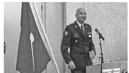
KKdt Thomas Süssli: Zufrieden mit dem Corona Einsatz seiner Truppen