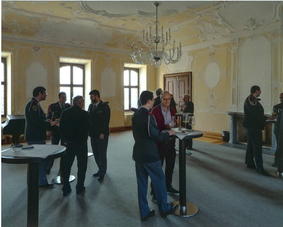
Apéro im Rittersaal des Seminarzentrums Hitzkirch