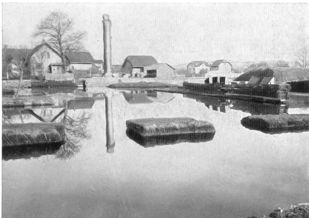
Fig. 27. Avenches: Cigognier et 'Pastlac' avant l'assainissement.

Au point de vue scientifique, l'exécution du collecteur permit de situer un certain nombre de constructions, plusieurs