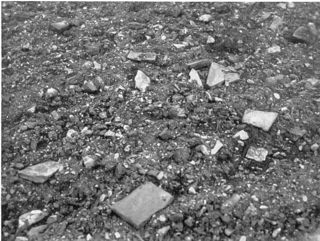
Abb. 9. Acker in Augst, mit römischen Ziegelstücken übersät.

Das Aufspüren urgeschichtlicher Fundstellen ist sozusagen eine Detektivarbeit. Sie verlangt höchste Aufmerksamkeit, Beachtung kleinster Ueberreste, Kombinationsgabe. Routinierte Geländeforscher erkennen bereits an einigen Tonbröcklein, die der Regen auf einem Maulwurfshaufen herausgewaschen hat, die Nähe einer Siedlung. Einen besonders scharfen Blick braucht es, um steinzeitliche Feuerstein-Werkzeuge zu finden. Sie unterscheiden sich kaum von gewöhnlichen Steinchen — der Kenner sieht sie sofort: Der matte Glanz ihrer Oberfläche, die scharfen Kanten und, bei näherem Zusehen, die feinen Retouchen (Abschläge). Es gibt Aecker,