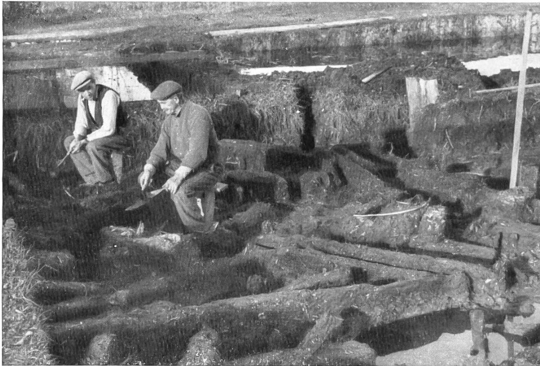
Abb. 11. Am Baldeggersee. Halbverfaulte Balken und Pfahlstümpfe eines Pfahlbaues werden freigelegt (vgl. Abb. 12).

oder pfahlartige Verfärbungen im Wandprofil können auf Wohnstätten oder Gräber hindeuten. Wichtig ist, dass der Finder seinen Vorgesetzten sofort von seinen Beobachtungen Kenntnis gibt. Diese entscheiden, ob es die militärischen Belange gestatten, die verdächtige Stelle genauer zu untersuchen. Wenn das möglich ist, dann heisst es: seinen „Gwunder“ bemeistern, Hände weg und warten, bis der Fachmann herbeigerufen ist. Es ist fast wie bei einem Kranken: Der Ungeschulte, der dem Arzt vorgreifen will, verdirbt meist mehr als er nützt. Und noch ein Grundsatz ist wichtig: Die Funde wenn immer möglich in ihrer Lage in der Erde belassen! Ein Gegenstand, der aus seinem Fundzusammenhang herausgerissen wird, verliert für die wissenschaftliche Bewertung in der Regel erheblich an Wert. Dass man sich auch in solchen Angelegenheiten absoluter Ehrlichkeit zu befleissigen hat, braucht dem Schweizersoldat nicht gesagt zu werden. Je nüchterner und zuverlässiger die Fundbeobachtungen gemacht werden, umso weniger werden wissenschaftliche Trugschlüsse vorkommen. Funde von Geldwert gehören zunächst