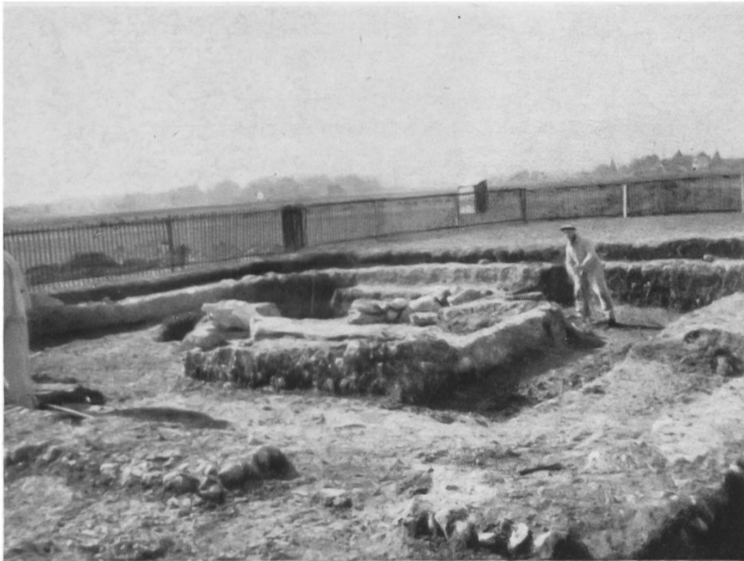
Fig. 25. Wavre, Mausolée. Vue d'ensemble.