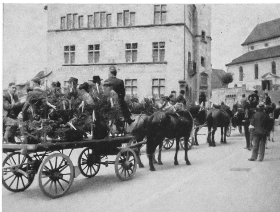
Abb. 37. Sursee. Exkursion der S. G. U. vom 29. Juni 1941. Die Wagenpartie vor dem Rathaus.