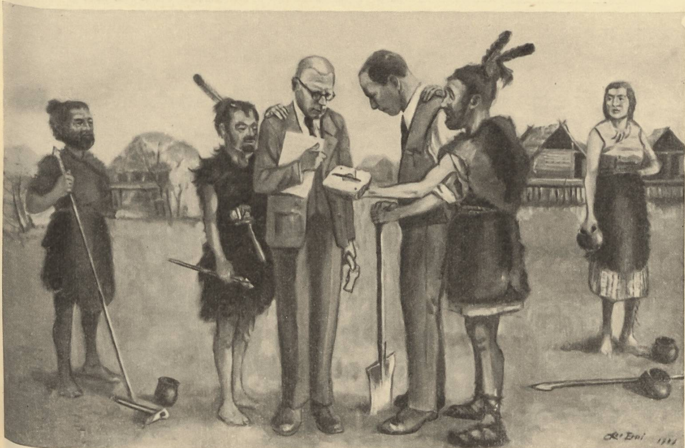
Leo Erni pinxit.