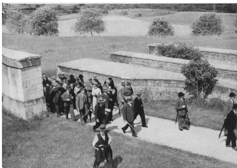
Abb. 36. Avenches. Die Teilnehmer der Exkursion vom 16. Juni 1941 beim Osttor.