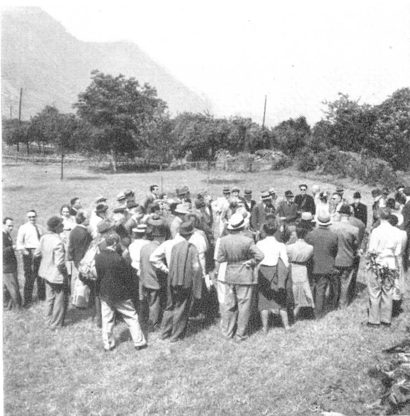
Abb. 31. Martigny. Die S. G. U. im Mauerring des Amphitheaters.