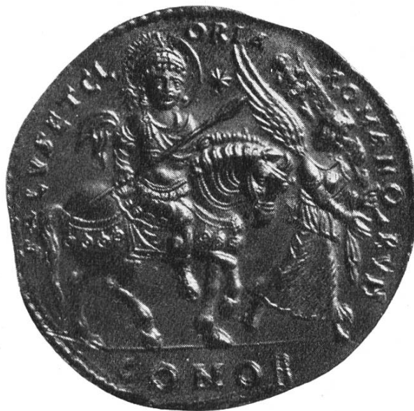
[ Abb. 31. Medaillon des Kaisers Justinian (527—565 n. Chr.) (aus J. Baum, Frühmittelalterliche Denkmäler der Schweiz, Abb. 12 und Numism. Rundschau 1939).

Vielleicht war diese Darstellung besonders bei den schweizerischen Burgundern beliebt und bedeutet sie eine interessante Verschmelzung des Reiterheiligen mit dem in Jerusalem einziehenden Christus. Inhaltlich ist sie auf alle Fälle mit den bekannten burgundischen Figurenschnallen verwandt, deren christliche Motive durch den intensiven Pilgerverkehr ins Heilige Land schon im 6. und 7. Jahrh. n. Chr. über Marseille nach Burgund gelangten und hier von den germanischen Kunsthandwerkern oft bis zur Unkenntlichkeit abgewandelt wurden. 6 )