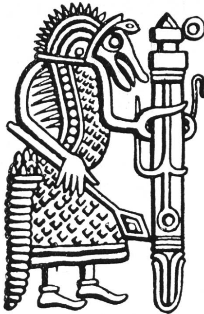
Abb. 30. Spatha von Gutenstein (Baden): Darstellung eines Maskenkämpfers (Volk und Vorzeit 1939).