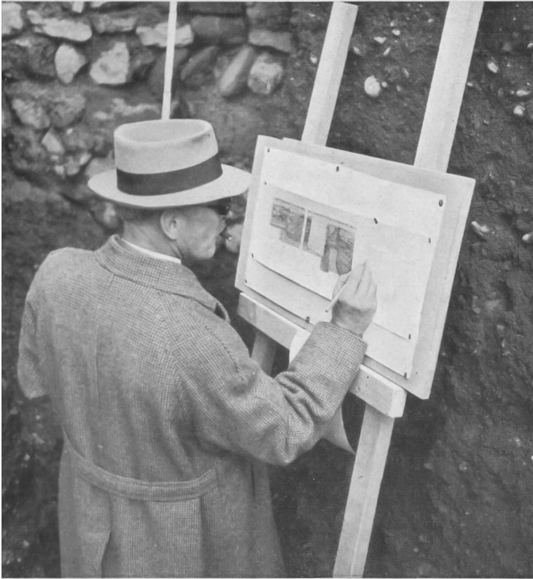
Fig. 7. Le dessinateur au travail. — Der Zeichner an der Arbeit.

livrer aux plus bas prix. Un double de chaque copie sera classé dans les archives photographiques et pourra être consulté à chaque instant.