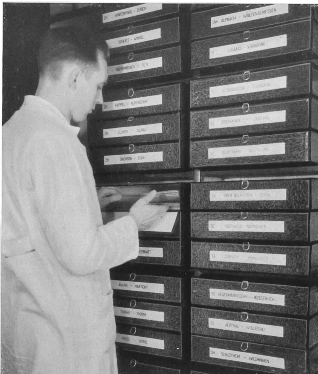
Fig. 2. Die Landesaufnahme. — Les archives topographiques.

Daneben möchte sich das Institut auch für die Auswertung des Fachwissens für die Allgemeinbildung einsetzen. Wohl jedermann kommt irgend einmal mit Bodenfunden oder Ausgrabungen in Berührung. Der Unwissende steht davor zumeist wie vor vernagelten Türen. Dem Kenner bedeuten sie eine Bereicherung seiner Einsicht in die Zusammenhänge