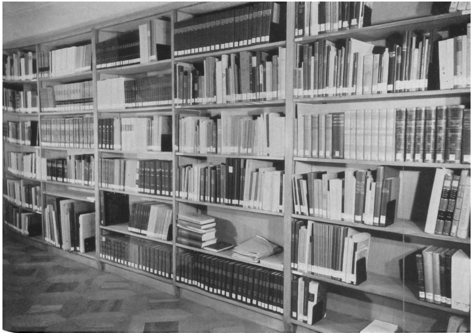
Fig. 1. Die Bibliothek des Institutes. — La bibliothèque de l'institut.

besondere von römischen Gebäuden, Gräberfeldern, Wasserleitungen, Strassen. Jährlich kommen infolge der rastlosen Forschungsarbeit neue hinzu. Das Institut hat es sich zur Aufgabe gemacht, einheitliche Kopien dieser Pläne zu erstellen und sie übersichtlich geordnet in seinem Archiv bereitzustellen. Wer die römischen Landhäuser, die spät-römischen Befestigungsanlagen, die frühmittelalterlichen Gräberfelder und anderes im Zusammenhang studieren möchte, soll das hier ohne grossen Zeitverlust und langes Suchen bequem tun können (Abb. 3).