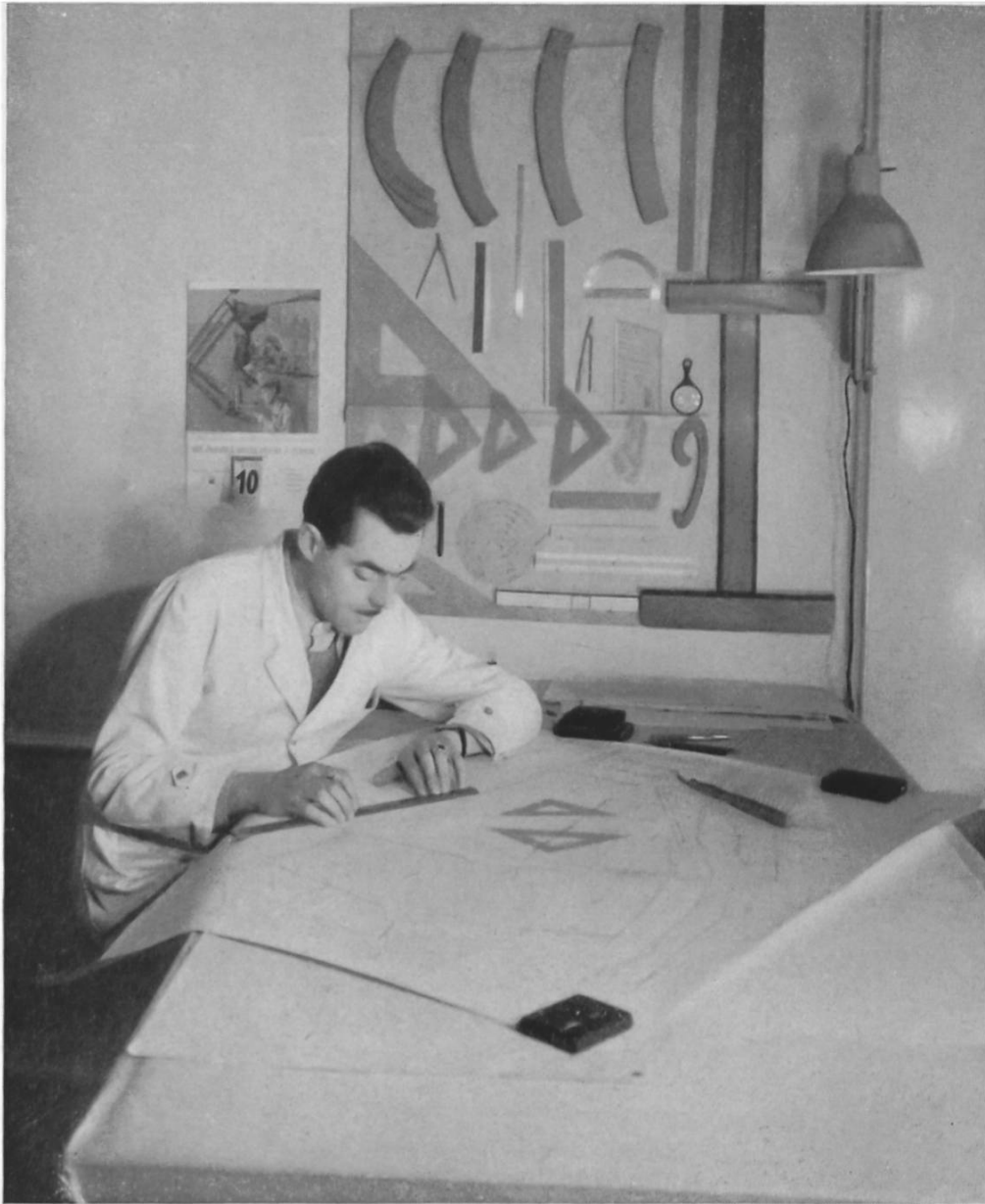
Fig. 4. Der Geometer. — Le géomètre.

Einblick zu gewinnen. Es wäre besonders schön, wenn es mit der Zeit gelänge, durch Stiftungen Freiplätze zu schaffen, um junge und qualifizierte Forscher mit besonderen Aufgaben zu betreuen. Mit dem Landesmuseum in Zürich besteht eine Abmachung, wonach die Assistenten dort auch in die praktische Museumstätigkeit eingeführt werden. In besonderen Lehrgrabungen des Institutes werden wissenschaftliche Prak-