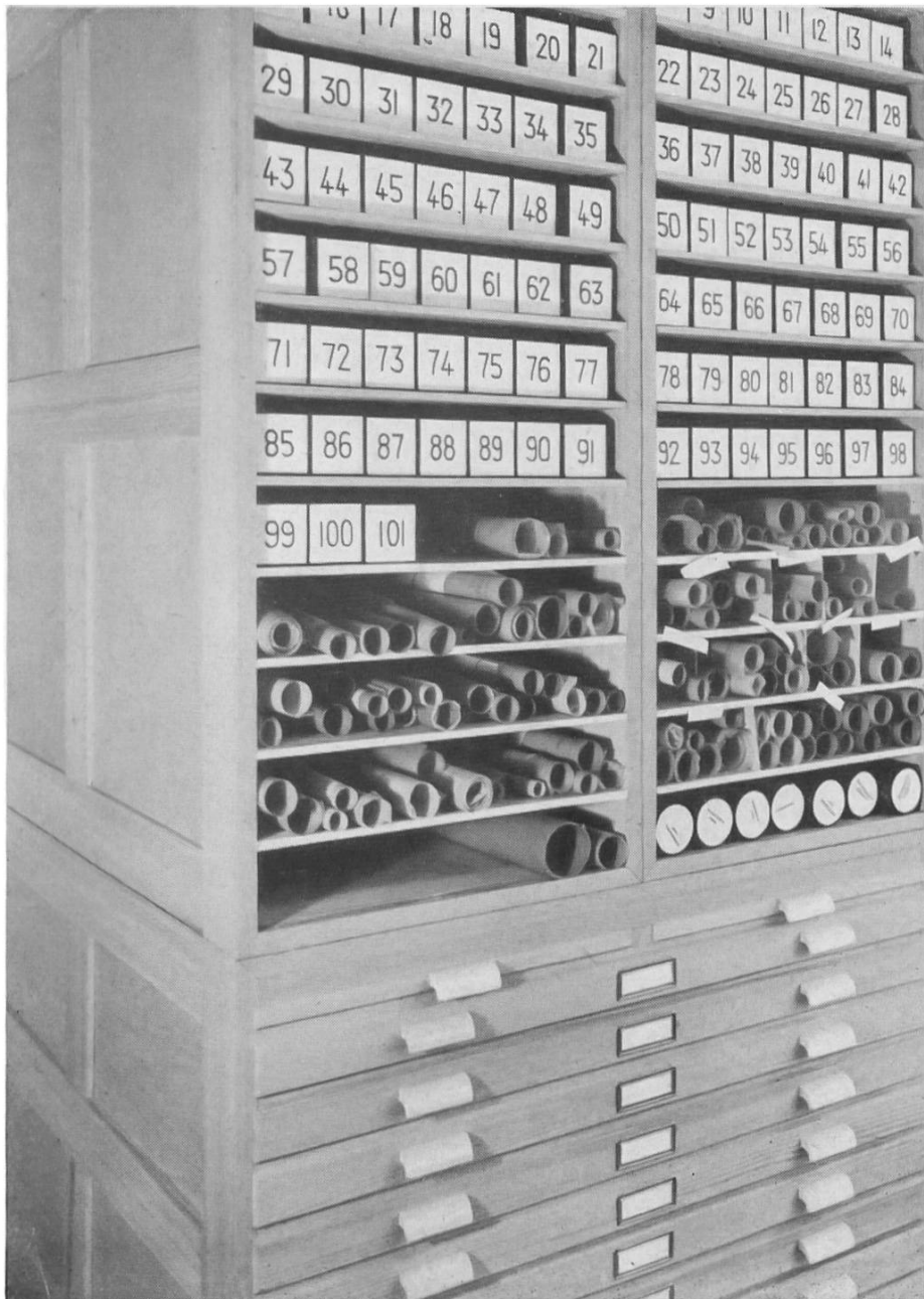
Fig. 3. Das Planarchiv. — Les archives des plans.

8. Ausbildung junger Archäologen. Es muss als ein besonderes Privileg gewertet werden, dass jungen Urgeschichts-Beflissenen die Möglichkeit geboten ist, am Institut gegen ein, allerdings bescheidenes, Entgelt eine Lehrzeit durchzumachen und in alle Gebiete der Forschung