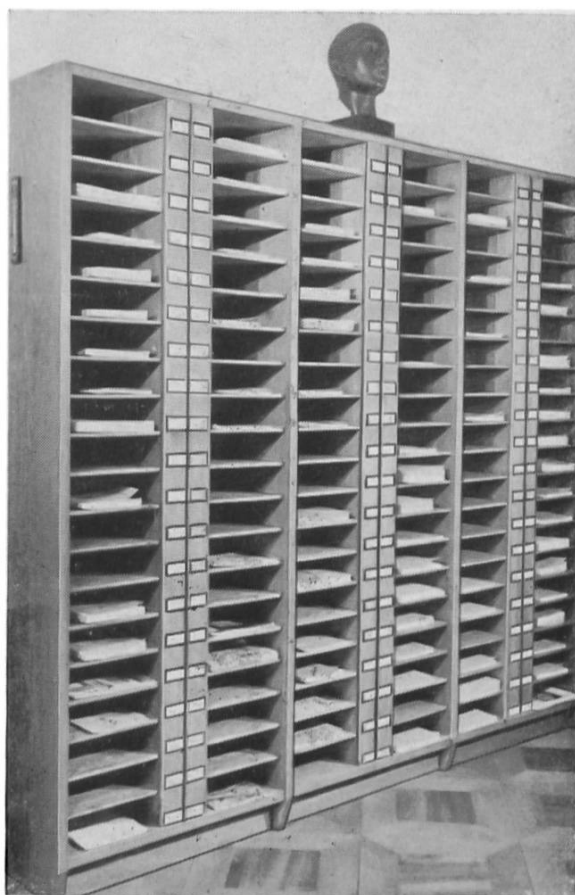
Fig. 6. Les revues. — Die Zeitschriften.

ressés et, dans la mesure du possible, de les leur prêter à domicile. Ceci déjà exige un gros travail, de la circonspection et des moyens financiers. Beaucoup d'ouvrages doivent être achetés d'occasion puis reliés. Les occasions et les bibliothèques privées mises en vente doivent pouvoir être achetées