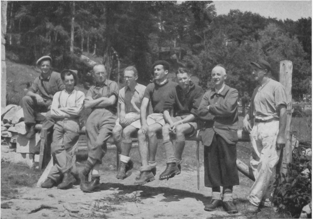
Fig. 9. L'équipe du premier camp archéologique de l'Institut à Vernand sur Mont-la-Ville (Vaud). — Erstes Schulungslager des Institutes: Archäologen und Arbeiter kameradschaftlich vereinigt.

trouvailles qui les incitent à d'intéressantes observations. La bibliothèque rend alors de grands services. En été, l'institut organise des excursions et visite des fouilles ou des musées dans les environs de Bâle ou dans un plus vaste rayon.