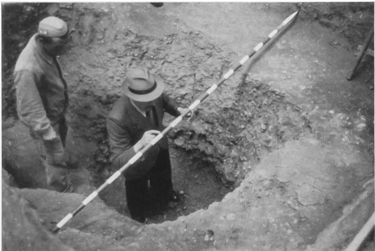
Abb. 11. Basel, Münsterplatz. Frühromische Grube neben Herdplatte (rechts).

überall auf den gewachsenen Rheinkies. In denselben eingetieft fanden sich in unregelmässiger Verteilung die bekannten Gruben, die man früher allgemein als Wohngruben betrachtete, die aber höchstens Kellergruben, meistens aber eher Abfall- und Abtrittlöcher, zum Teil vielleicht auch gewerbliche Anlagen darstellen dürften. Sie enthielten zahlreiche Abfälle, zerschlagene Tierknochen und viele Tonscherben aus spätgallischer und frühromischer Zeit. Die spätgallische Keramik gleicht noch stark den bekannten Funden aus der gallischen Ansiedlung bei der alten Gasfabrik (vgl. E. Major, Gall. Ansiedlung mit Gräberfeld bei Basel, 1940), so besonders die rot, schwarz und weiss bemalten, schönen Schalen und hohen Krüge, aber auch die groben Kochtöpfe mit Kammstrichverzierung und Grübchenreihen, sowie die Näpfe mit eingelegtem Rand. Interessant ist, dass