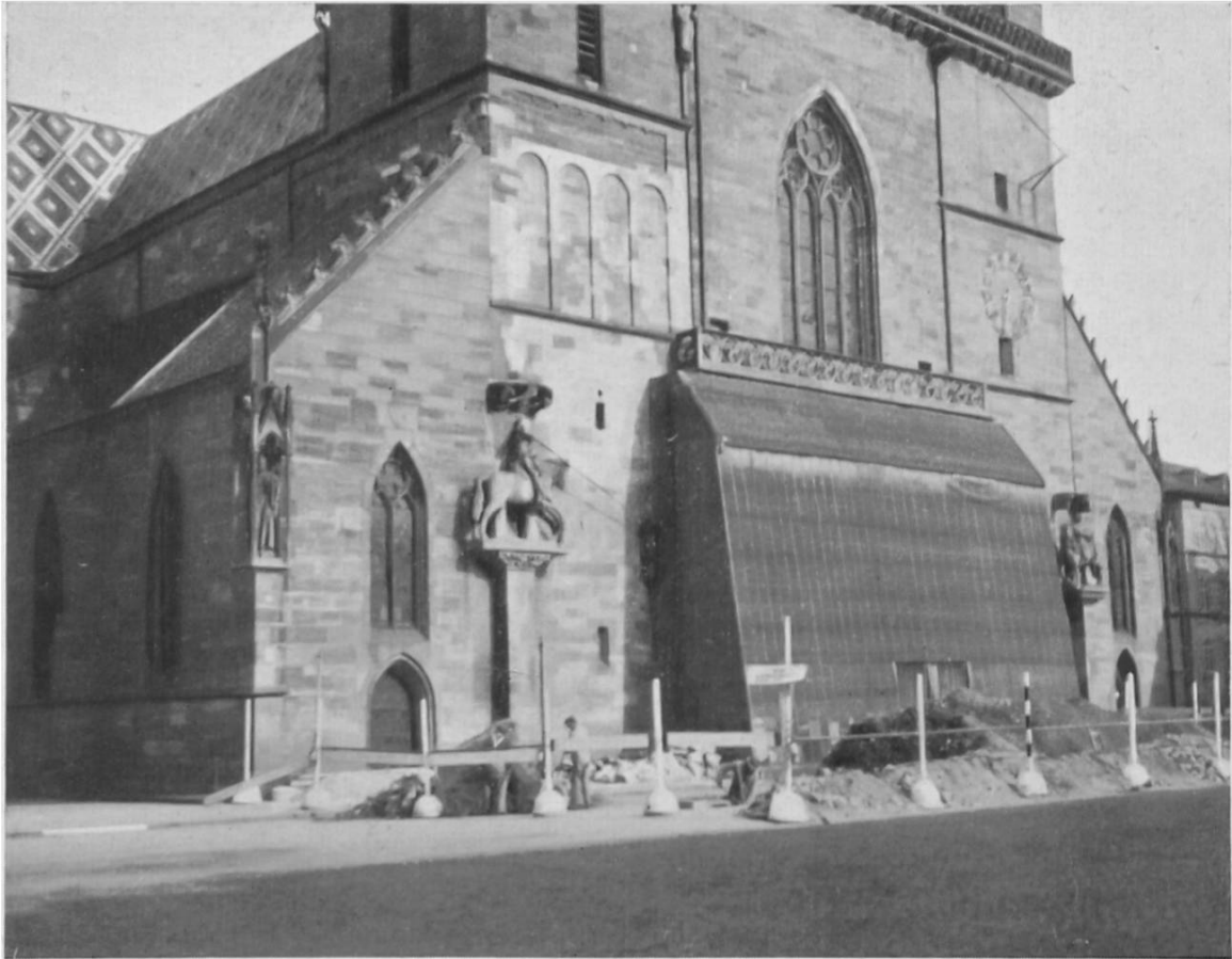
Abb. 10. Basel 1944. Ausgrabungen vor dem Münster.

sammengefasst, was bis zu diesem Zeitpunkt über die Ur- anfänge der Stadt bekannt geworden war und aus den Boden- funden geschlossen werden konnte. Danach hätte sich hier zunächst eine spätgallische Ansiedelung mit einem grossen Halsgraben gegen den offenen Süden hin befunden, die von den Römern bald nach ihrer Ankunft besetzt worden wäre und sich im 1. Jahrhundert n. Chr. zu einem stadtähnlichen, neben Augst allerdings nicht aufkommenden Vicus entwickelt hätte.